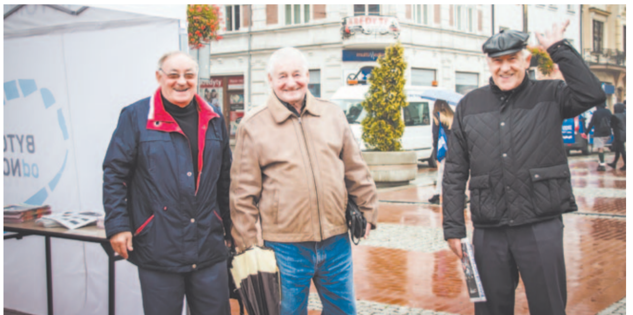
Konsultacje społeczne w Lotnych Punktach Informacji, październik 2016 r.

Sztandarowym projektem ukierunkowanym na pomoc dla seniorów (i nie tylko) będzie utworzenie Centrum Seniora i Centrum Przedsiębiorczości przy skrzyżowaniu ul. Wrocławskiej 6 i Batorego 2. Znajdzie się tam kompleks obejmujący: żłobek z ogrodem i ogródkiem edukacyjnym, klub seniora z siedzibą Uniwersytetu Trzeciego Wieku, Poradnia Zdrowia Psychicznego i Inkubator przedsiębiorczości z ukierunkowaniem na świadczenie usług dla osób starszych.