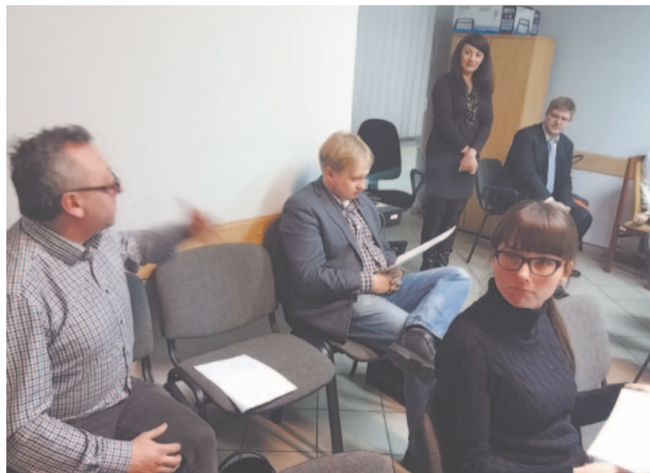
Uczestnicy warsztatów mieli sporo cennych uwag do projektu uchwały. Wszystkie zostały uwzględnione.