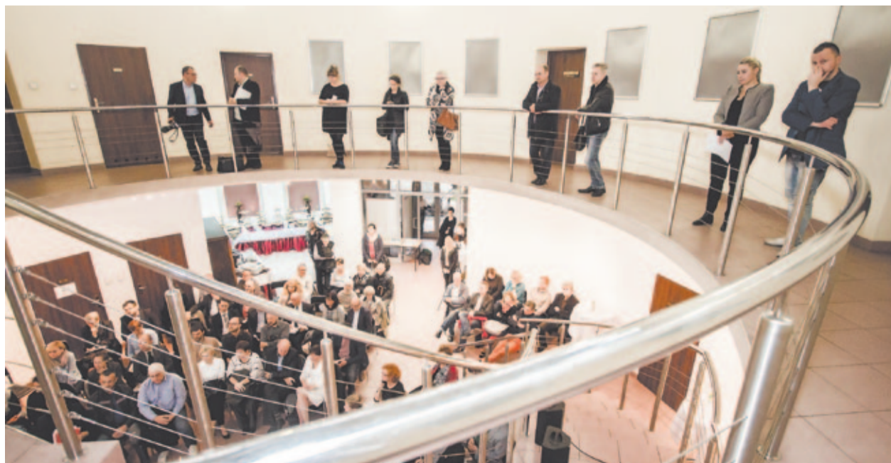
Debata o GPR, październik 2016 r.

Ze wszystkimi uwagami, które wpłynęły do urzędu na temat GPR-u ciągle można się zapoznawać. Wystarczy wejść na stronę bytom odnowa.pl i kliknąć w zakładkę „dokumenty do pobrania”.