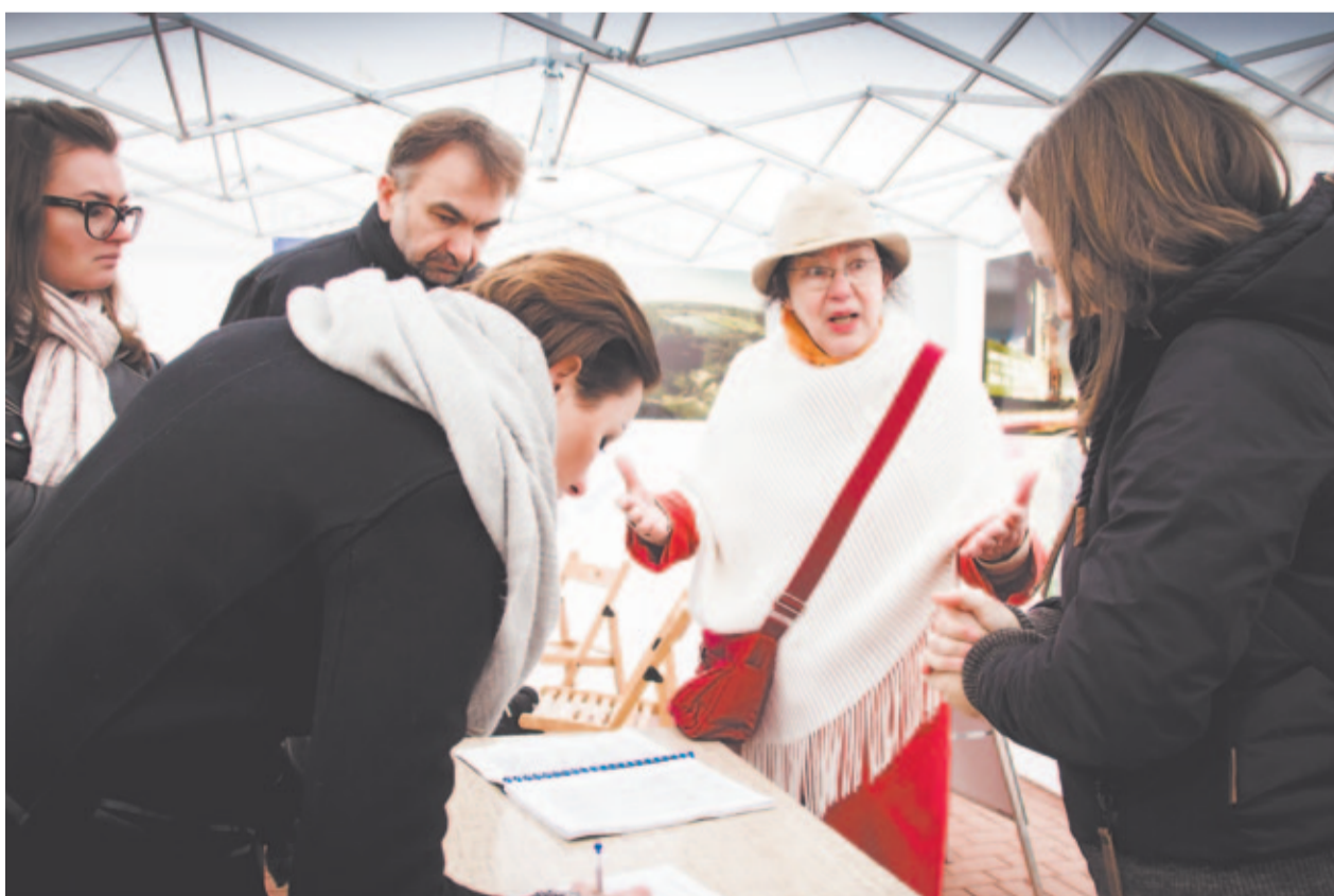
Konsultacje społeczne GPR-u na Rynku. Pytaniom nie było końca.

Rewitalizacja Bytomia wkracza w kolejny etap.