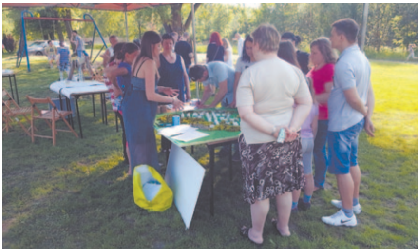
Ożywiona dyskusja o przyszłości dzielnicy przyniosła efekt...