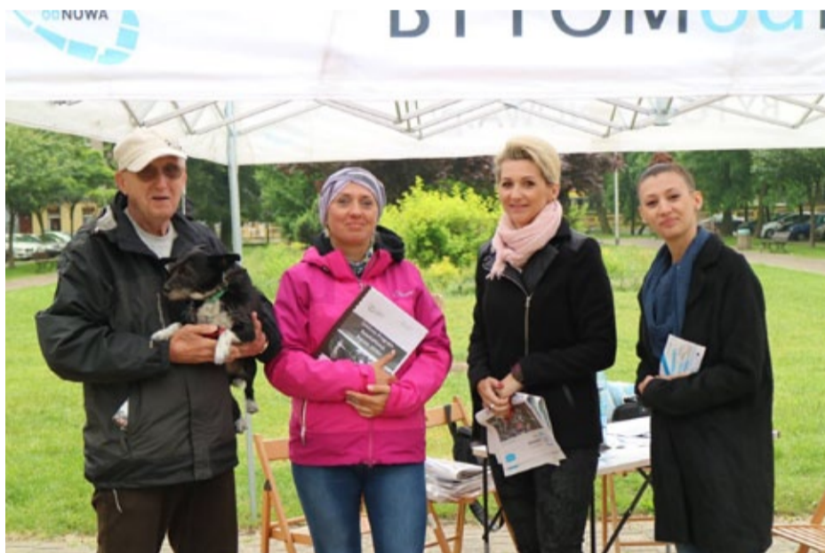
...na Placu Słowiańskim...