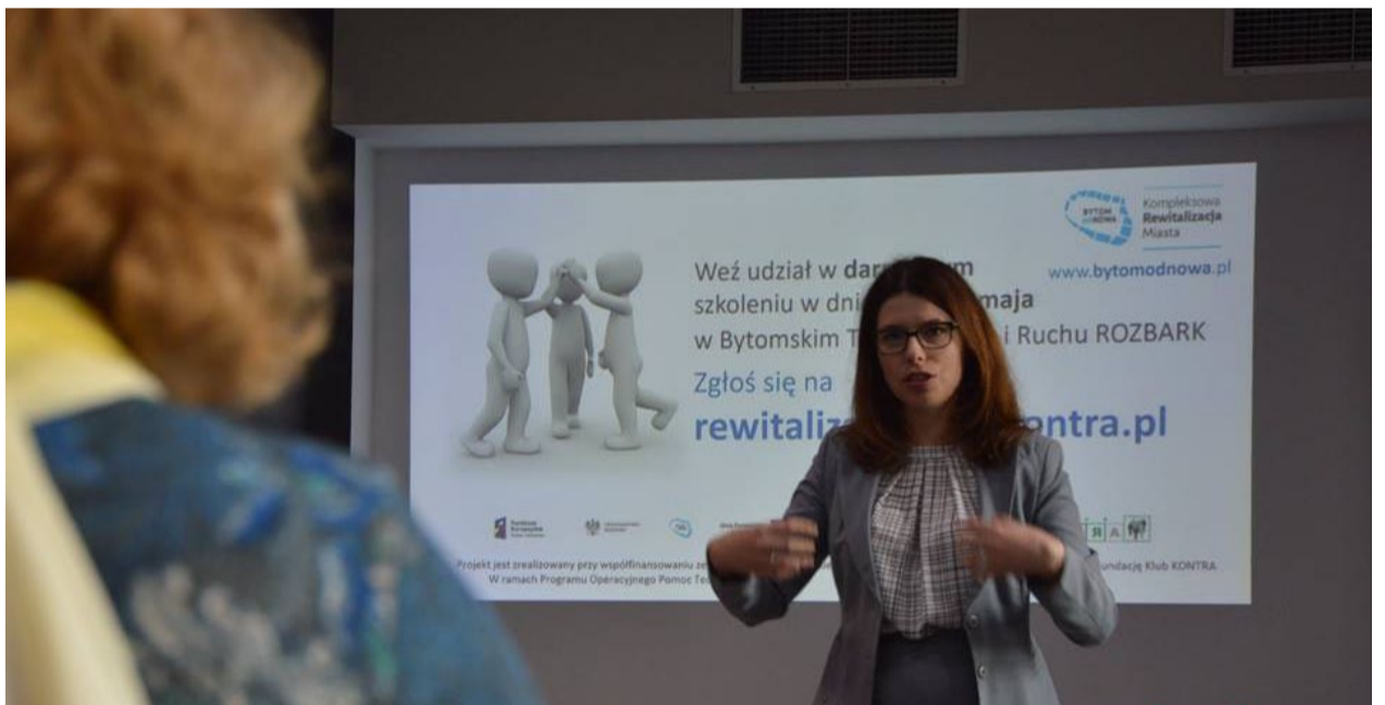
Na innym ze szkoleń udzielano praktycznych porad, jak pozyskiwać dotacje na działania.