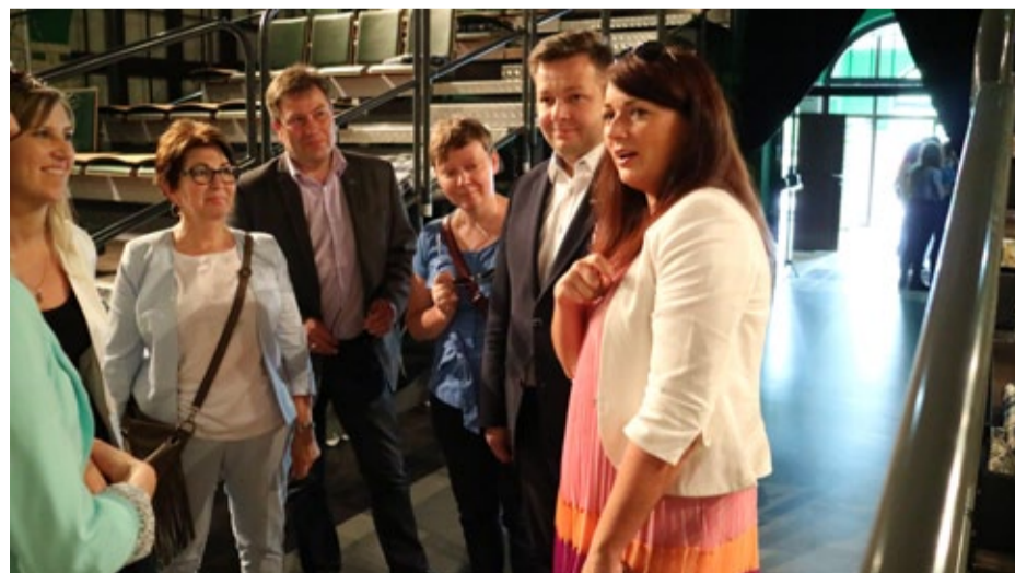
...później mogliśmy się pochwalić. Pokazywaliśmy gościom m. in. Teatr Rozbark.