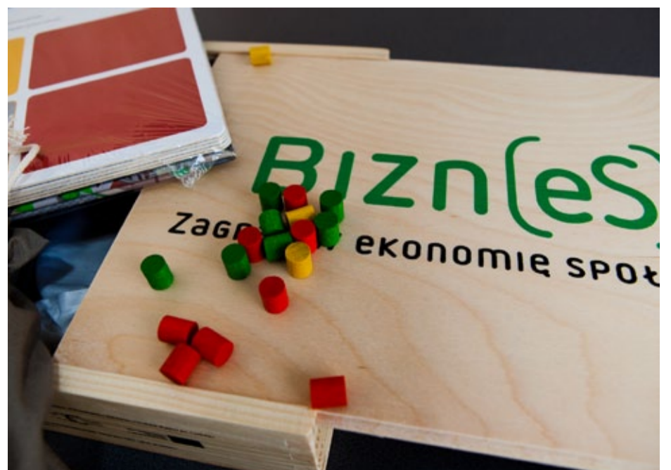
...wyczarowują dzieła, które chętnie kupują międzynarodowe koncerty.