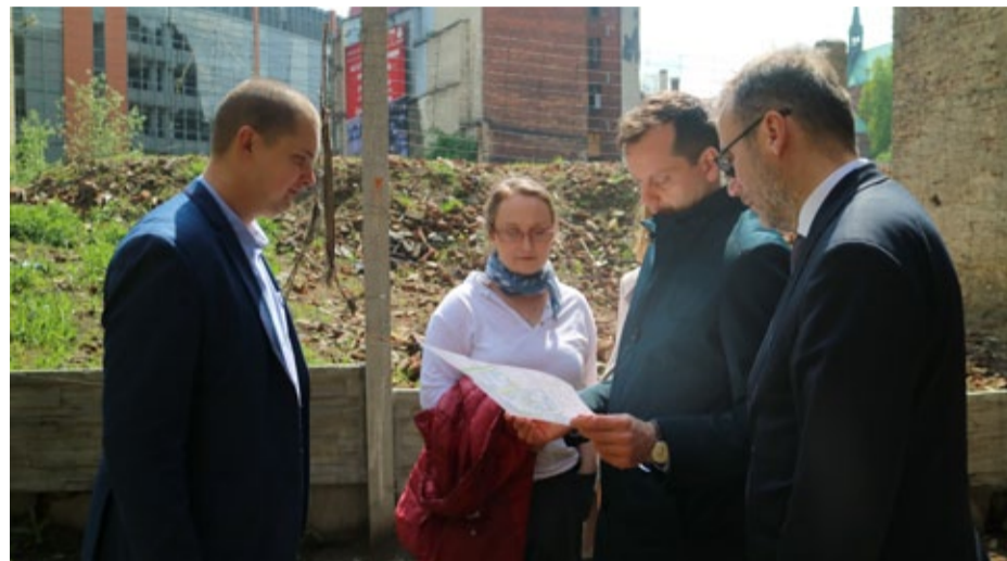
Jeden z kwartałów pilotażu. Na razie monitorowany przez ministerstwo, za jakiś czas może się zmienić z udziałem mieszkańców.

Program wizyty przedstawicieli Ministerstwa Rozwoju w Bytomiu obejmował również wizję lokalną. Goście obejrzeli kilka budynków znajdujących w kwartałach pilotażu i teren po zakładzie Córnośląskiej Kolei Wąskotorowej. Odwiedzili też punkt informacji w Teatrze Rozbark.