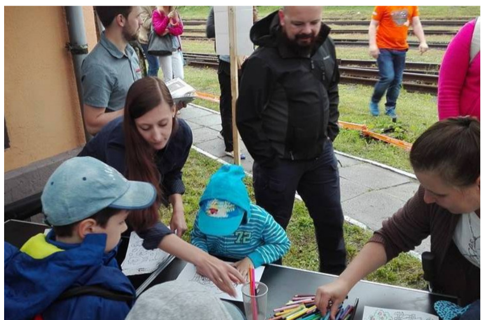
...i stacji kolejki wąskotorowej.