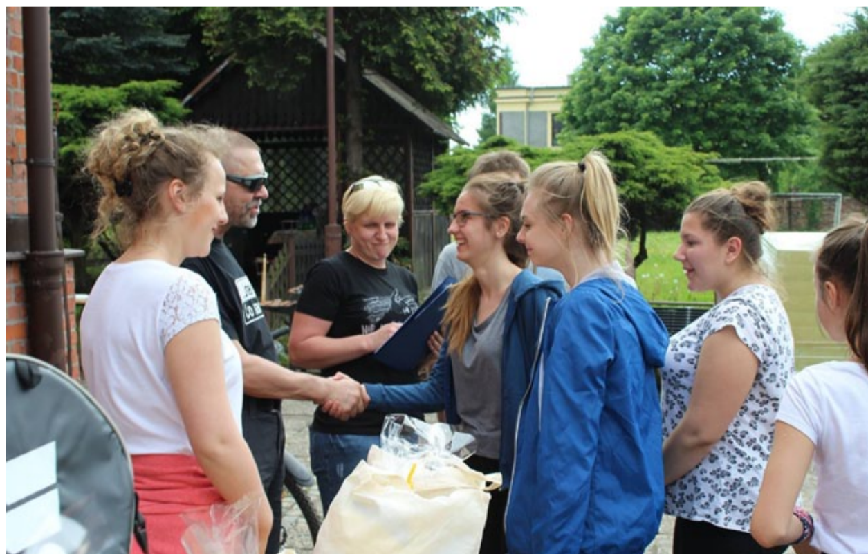
...jak widać, z powodzeniem. Na organizowane przez niego zabawy przyjeżdżają ludzie, którzy w dzielnicy nie mieszkają już po kilka lat.