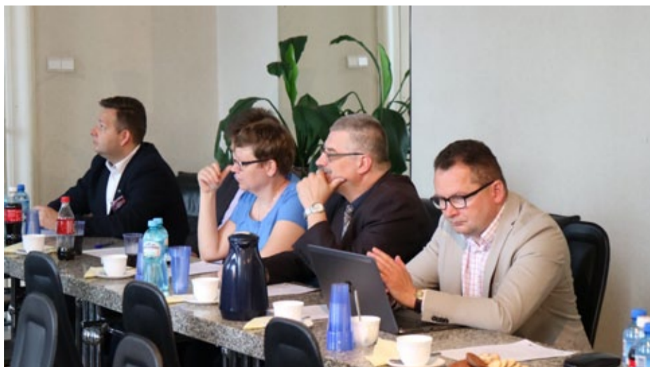
Najpierw dzielimy się doświadczeniami w zakresie delimitacji...

Obszary przeznaczone do rewitalizacji zostały zatwierdzone przez Radę Miejską w marcu 2016 roku.