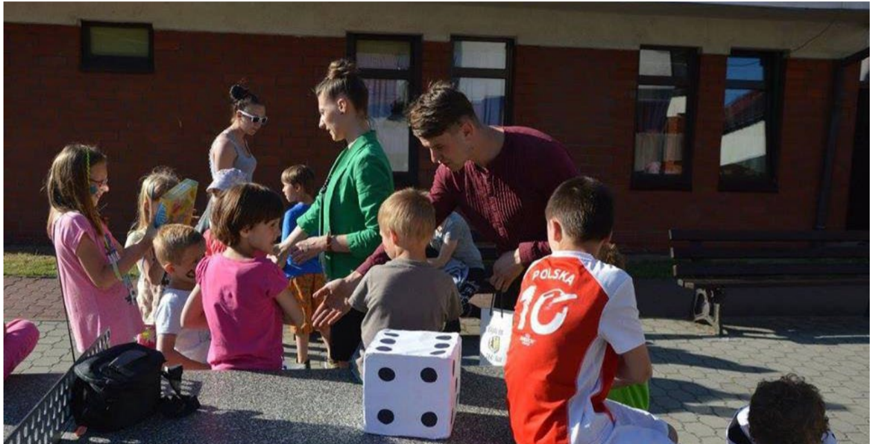
Można i warto stać się animatorem lokalnym – przekonywali podczas jednego ze szkoleń członkowie Klubu Kontra.