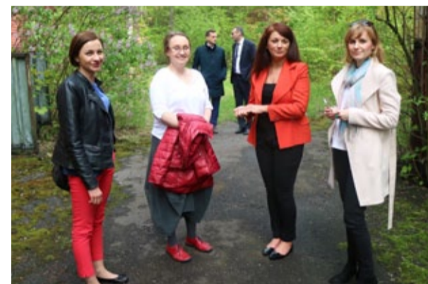
Teren po byłym zakładzie zabytkowej kolejki był wizytowany przez przedstawicieli Ministerstwa Rozwoju. Uważają, że ma on ogromny potencjał.

Centrum Doradztwa Strategicznego (CDS) jest firmą konsultingowo - badawczą działającą w zakresie planowania i zarządzania strategicznego oraz doradztwa głównie dla instytucji publicznych. Firma posiada status instytucji szkoleniowej, jest wpisana do rejestru podmiotów prowadzących agencje zatrudnienia jako agencja poradnictwa zawodowego i agencja doradztwa personalnego. Zatrudnia na stałe lub do realizacji konkretnych projektów kilkudziesięciu konsultantów, ekspertów, trenerów, wykładowców. CDS korzysta również z usług doradców brytyjskich (Redshaw Associates, Stevens & Associates - rekomendowanych przez The British Council) oraz amerykańskich (firmy Berman Group rekomendowanej przez USAID).