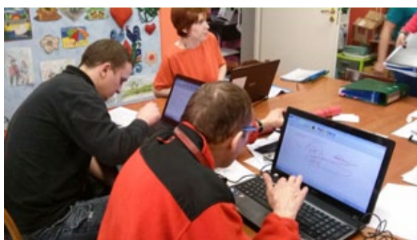
Zajęcia komputerowe są jednym z elementów terapii.

Problem delikatny. Skuteczna pomoc. 25 mieszkańców DPS dla Dorosłych, 30 osób z zaburzeniami psychicznymi (mieszkańców Bytomia), a także 60 opiekunów takich osób, otrzyma wsparcie w ramach projektu „W partnerstwie skuteczni - do-