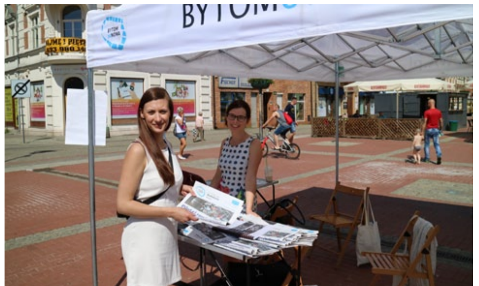
Mobilny punkt informacji na Rynku...

Lotne punkty są przede wszystkim okazją do rozmów o rewitalizacji, zmianach, które czekają miasto. Przypomnijmy, że pracownicy punktu przede wszystkim udzielają praktycznych porad dotyczących projektów, związanych z odnową miasta. Pomagają przygotować wnioski o dotacje, radzą, gdzie uzyskać pomocy starając się o unijną dotację.