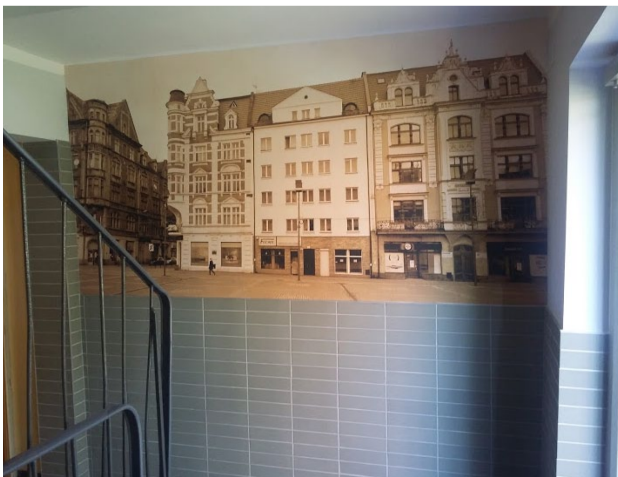
...i zapierający dech w piersiach efekt prac.