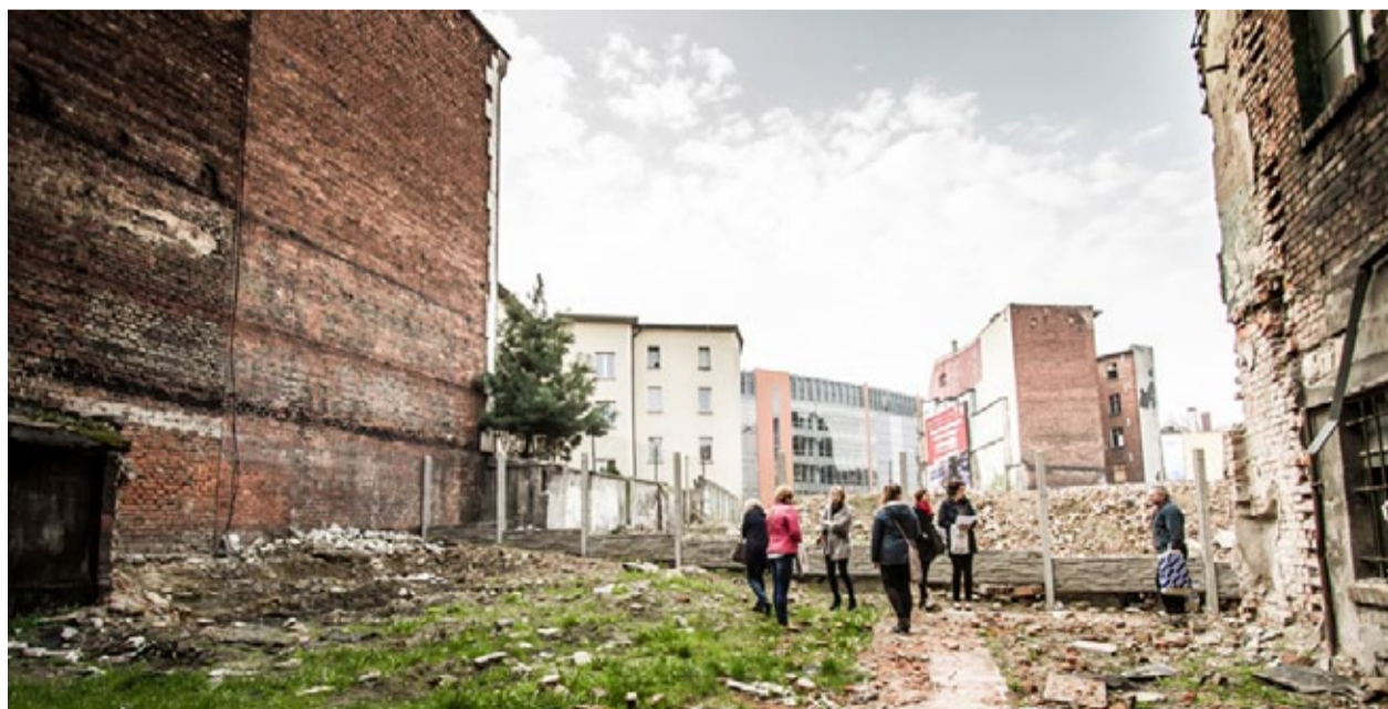
Niestety, z takimi widokami mamy do czynienia w centrum miasta, pilotaż ma to zmienić.

O tym, na czym polega pilotaż rewitalizacji piszemy w głębi tego wydania gazety. Warto zaznaczyć, że o jego ostatecznym kształcie zdecydowało Ministerstwo Rozwoju. Umowa pomiędzy miastem a ministerstwem została podpisana w grudniu 2016 roku.