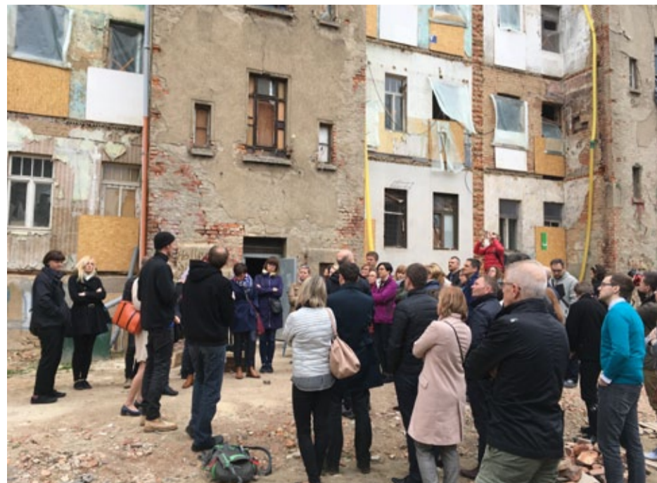
Mimo, że rewitalizacja w Lipsku trwa od 30 lat, nie brak w tym mieście widoków zniszczonych budynków.

dzialni za rozwój miast w państwach członkowskich Unii Europejskiej preambule Karty Lipskiej napisali: Uważamy miasta każdej wielkości, które ewoluowały z biegiem historii, za cenne i niezastąpione dobra gospodarcze, społeczne i kulturowe. Dokument zawiera zalecenia, których zastosowanie ma przyczyniać się do poprawy życia mieszkańców. Założenia Karty Lipskiej realizuje też Bytom.