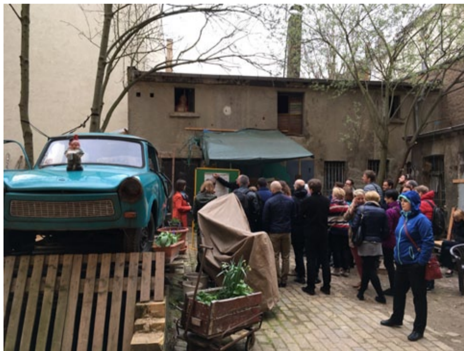
O wyglądzie podwórek w Lipsku w dużej mierze decydują lokatorzy.

Warto dodać, że w 2007 roku to właśnie w Lipsku podpisano bardzo ważny dokument – Kartę Lipską, który przyczynił się do procesu zrównoważonego rozwoju miast. Ministrowie odpowie-