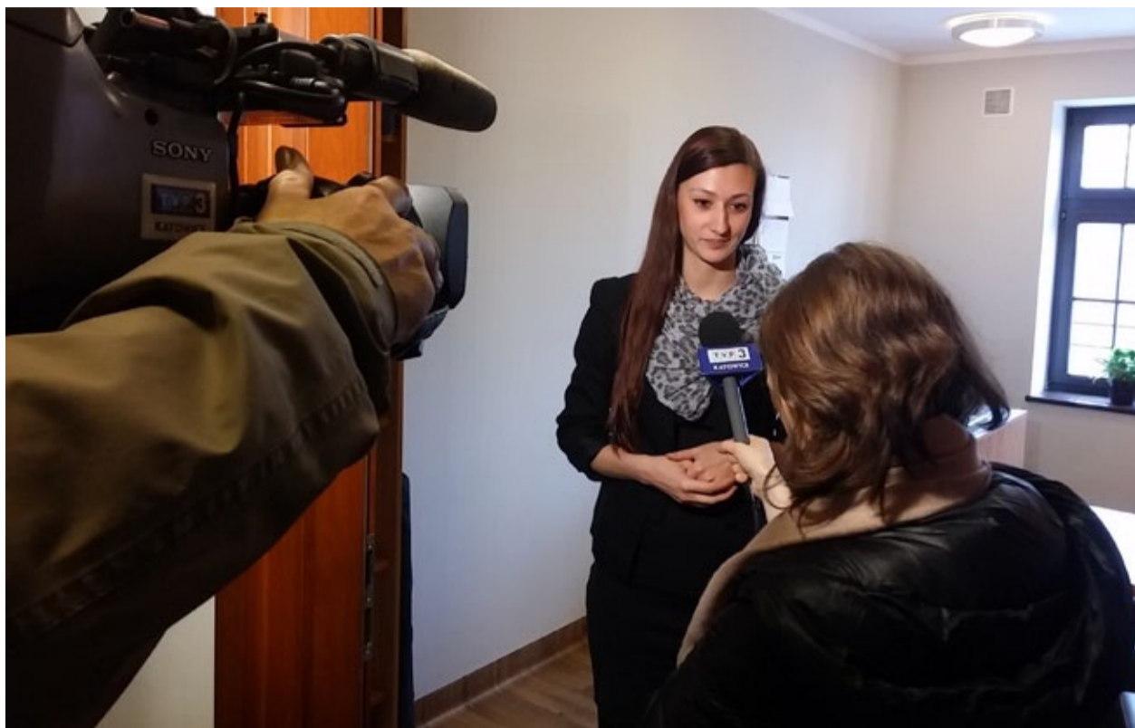
Otwarcie punktu cieszyło się dużym zainteresowaniem medialnym.

Ruszyliśmy 20 marca – a konkretnie ruszyła Fundacja Klub Kontra, która złożyła ofertę na prowadzenie takiego punktu. Zapraszamy wszystkich, którzy mają jakiegokolwiek pytania o rewitalizację, albo chcieliby uzyskać pomocy specjalistów. W punkcie dyżurują: radca prawny, architekt i finansista.