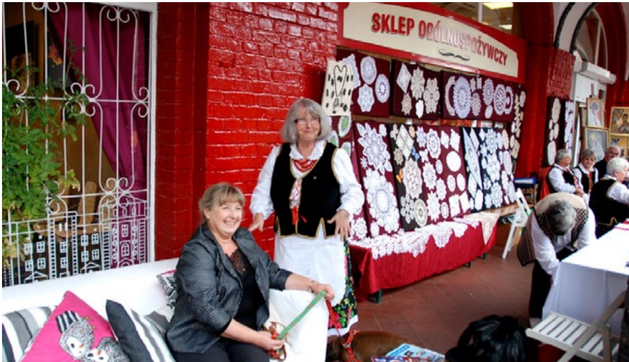
Jarmarki na Nikiszu ściągają do Katowic tysiące miłośników tradycji

W tym powstałym na początku XX wieku osiedlu podstawą codziennego życia były więzi sąsiedzkie. Z biegiem czasu mimo tradycji i kapitału społecznego nieremontowana dzielnica niszczała. Niski standard mieszkań sprawił, że stopniowo zmieniano je w mieszkania socjalne, a miejscowe tradycyjne wartości zaczęły blaknąć. Podobnie, jak w Bytomiu, prawda? Zwłaszcza w podobnych rewitalizacji.