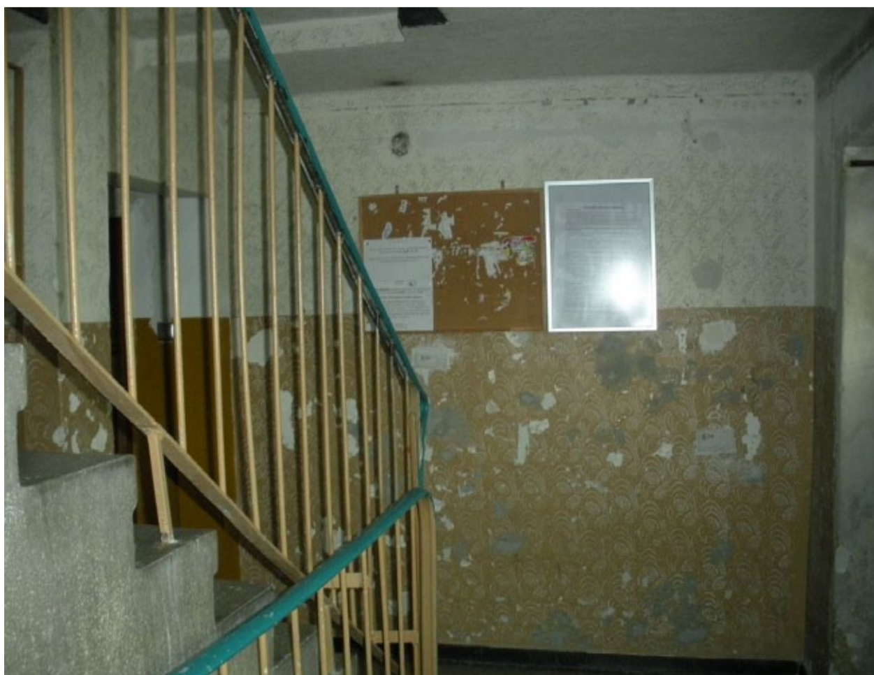
Klatka schodowa przed remontem...

Miejsca, które wchodziły w skład kwartału pilotażowego, będą poddane szczegółowej analizie. Będą przebadane one nie tylko pod kątem technicznym, ale również oczekiwani obecnych i przyszłych najemców.