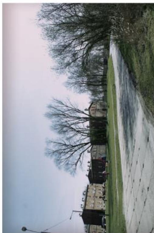
Główna droga wyłożona płytami.