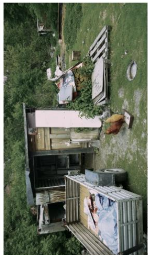
Zapotrzebowanie na osiedlowy kurnik.