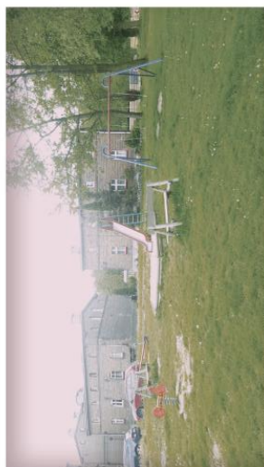
Niska jakość i estetyka placu zabaw.