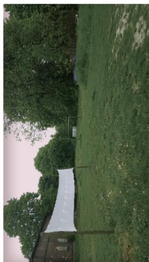
Brak boisk dla dzieci i młodzieży.