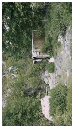
Dziki wysypiska śmieci.