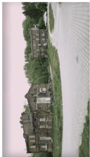
Historyczny/chaotyczny układ dróg na osiedlu / zle dobrany materiał.