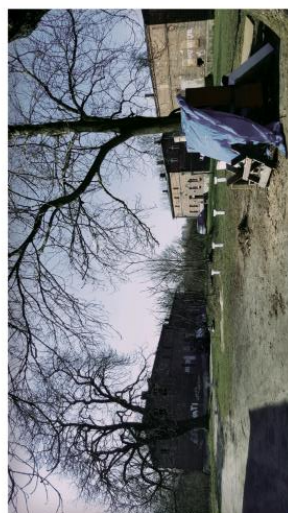
Niski standard przestrzeni publicznych.