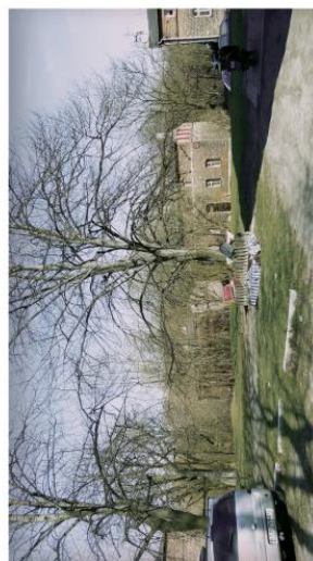
Brak odpowiednich miejsc spotkań.