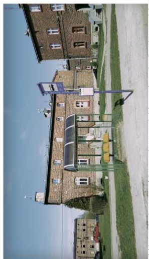
Niski standard przystanków autobusowych/niepasujące do charakteru miejsca.