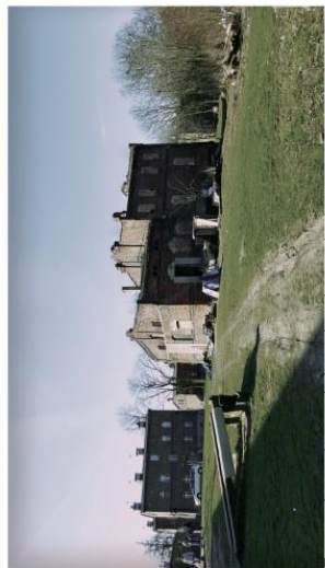
Zapotrzebowanie na osiedlowy kanał samochodowy.