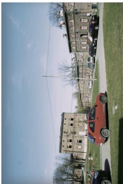
Brak stref parkingowych, „zaśmiecenie” krajobrazu samochodami.