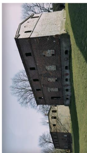
Budynki w złym stanie technicznym.