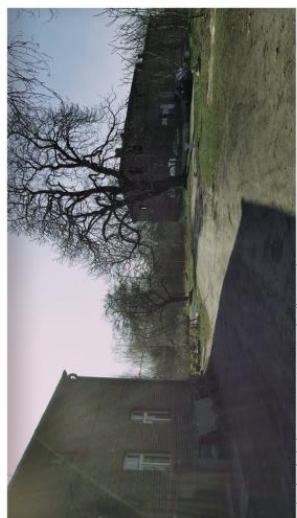
Brak sieci dróg, wewnątrz osiedlowych.