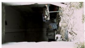
Zapotrzebowanie na osiedlowy warsztat.