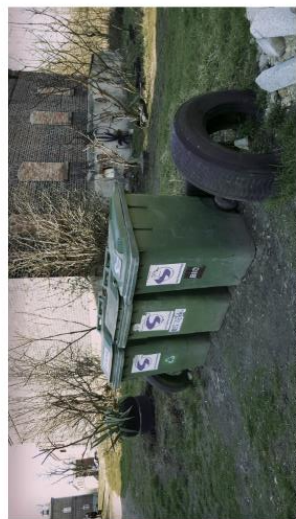
Niska estetyka miejsc składowania odpadów.